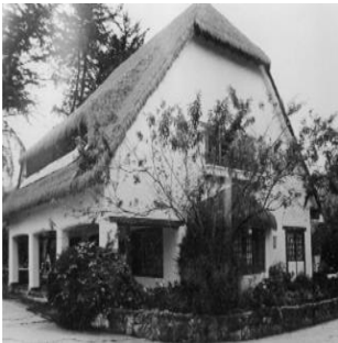
Universidad El Bosque