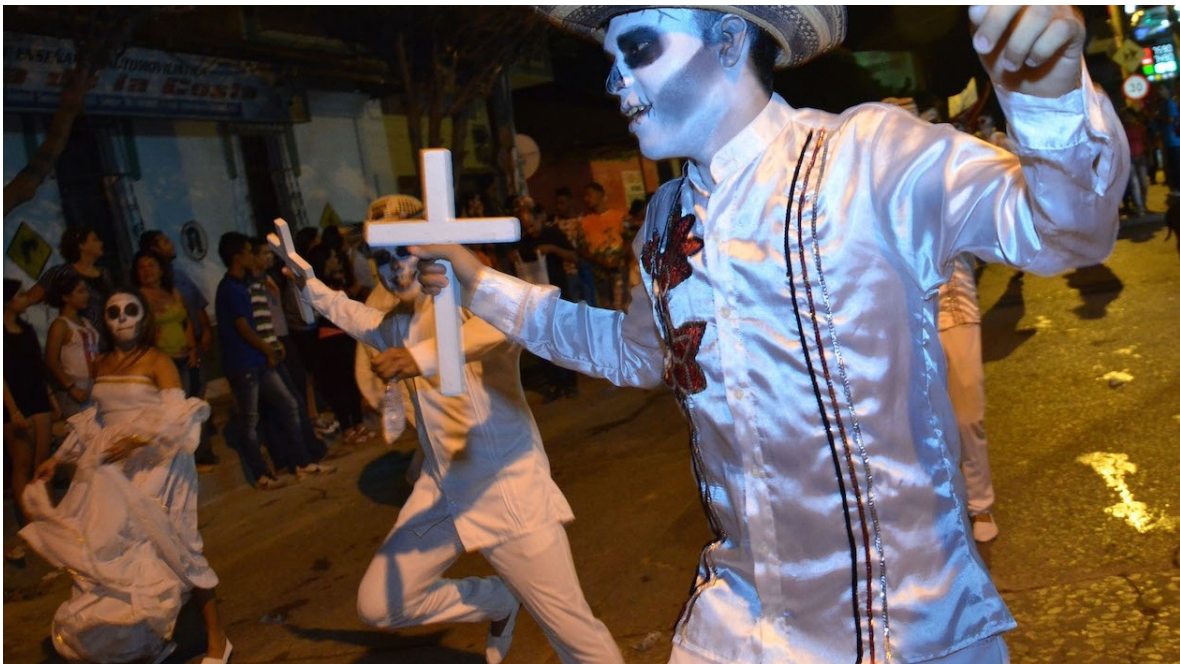
Zona Cero, 20 de enero del 2016. Grupo Reminissencia

La única danza con ritmo de cumbia “ sentada” es el Grupo escénico Reminiscencia con mínimo de diez parejas , todos con vestidos blancos y sus caras maquillaje con motivo de una marcara de muerte. Que por michos años ha presidido el desfile permitiendo bajarle a la velocidad de los mismo, debido a que las parejas van bailando cumbia de manera serena y acompasada