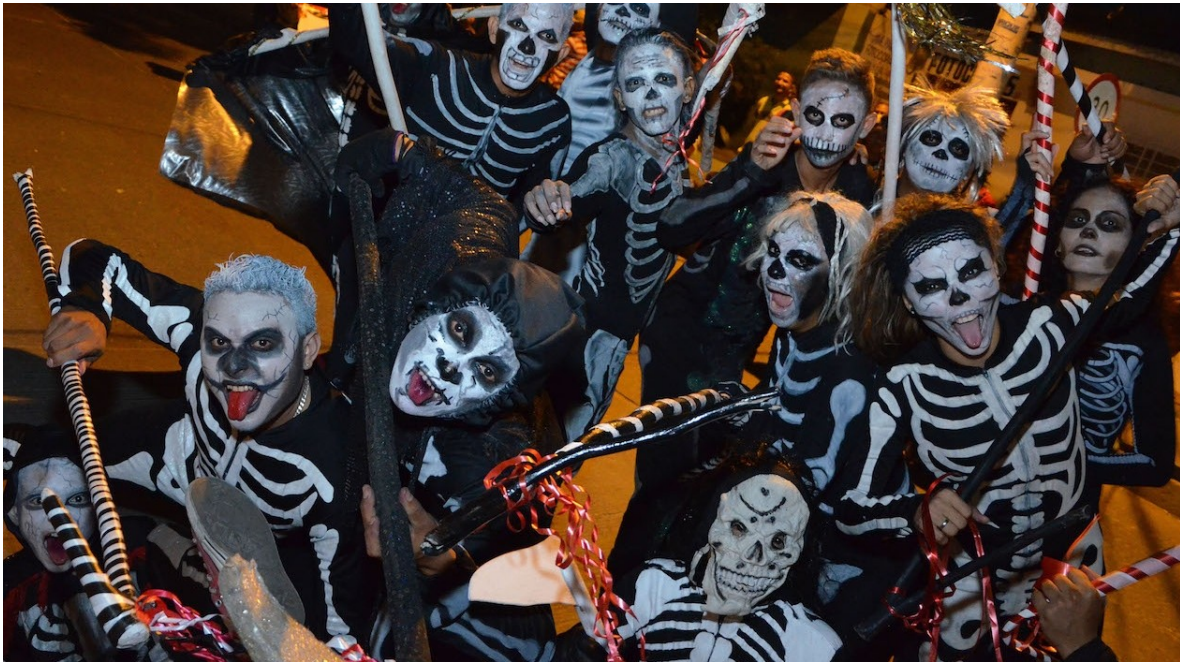
Zona Cero-Ceremonial enero de 2016

El ceremonial de la muerte de Soledad , es una sucesión de imágenes presididas por la Muerte- como personaje central- generalmente , representado por una disfraz de tela ceñido al cuerpo pintado con la figura de un esqueleto humanos y que, en actitud de danzar dialoga y arrastra ,uno por uno, a los personajes habituales representativos de las diferentes clases sociales.