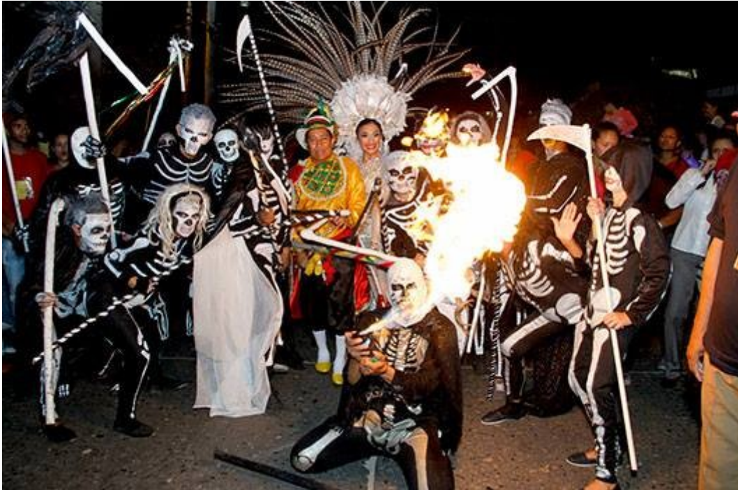
Ceremonial de la muerte 2015.

En el 2015(32) en los carnavales de Maria De La Hoz Toscano ( 2014 ).