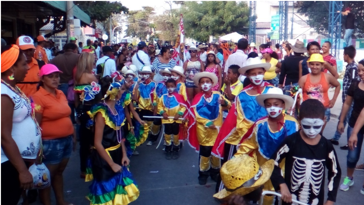
Muerte con garabato infantil de Son La Perrencia.