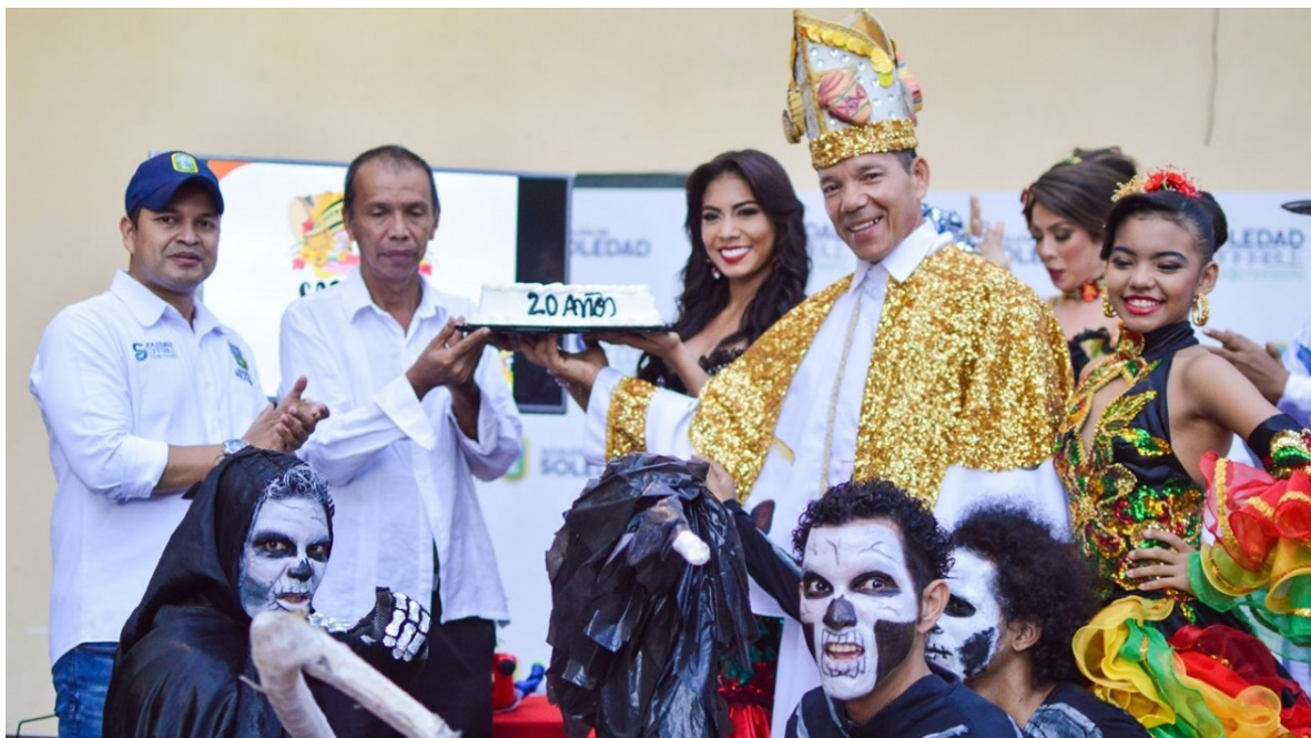
XX aniversario del ceremonial de la muerte de Soledad 2018.