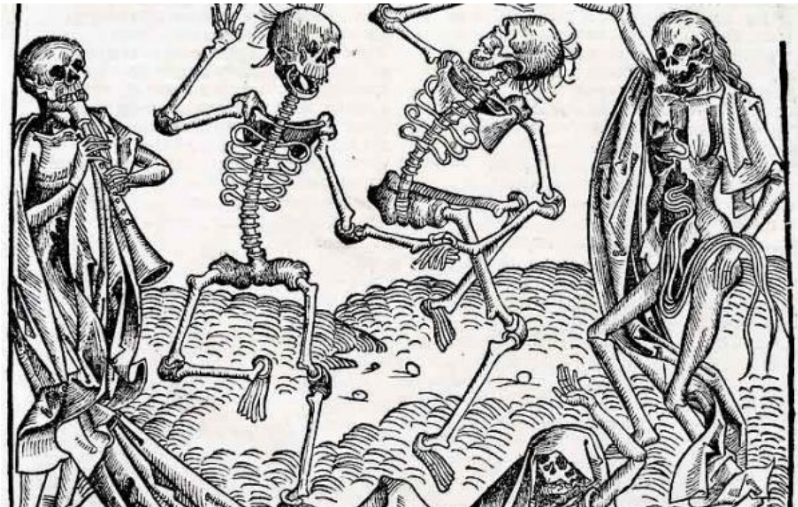
La Danza de la Muerte de Michael Wolgemut .

Por todo ello muchos especialistas consideran como idea germinal de las danzas de la muerte la creencia alemana en las danzas nocturnas en los cementerios. De aquí deriva la iconografía macabra que luego aparecerá junto al texto de la danza de la muerte. Se representan esqueletos o cuerpos en descomposición danzando sobre las tumbas y tocando instrumentos musicales como la flauta o el violín